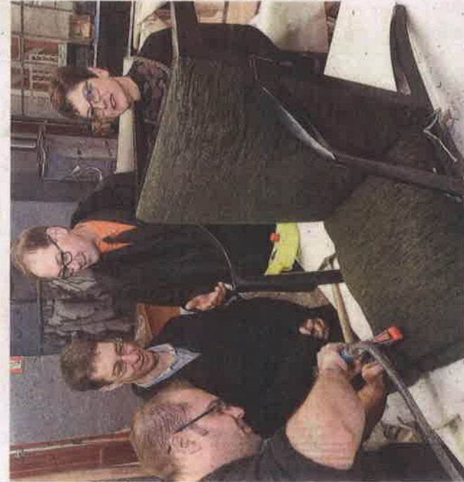
La remise de l'IGP Siège de Liffol à la présidente du Pôle lorrain de l'ameublement bois (Piab), était suivie par une visite des établissements Cooat-Blandin et Laval.